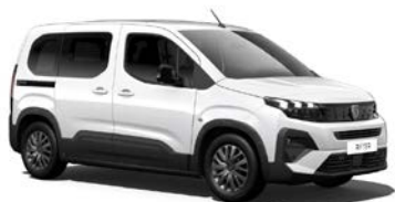
Kaolin Weiß 1)