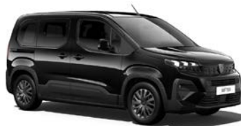
Perla Nera Schwarz 2)