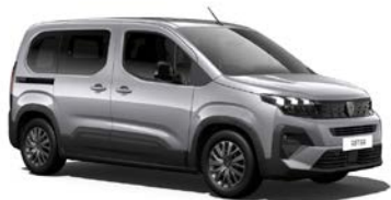
Artense Silber 2)