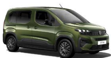
Sirkka Grün 2)