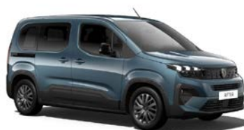
Kiama Blau 2)