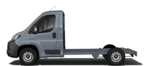
EISEN GRAU M0ZW 700,00 (833,00)