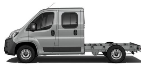
STAHL (ARTENSE) GRAU M0F4 700,00 (833,00)