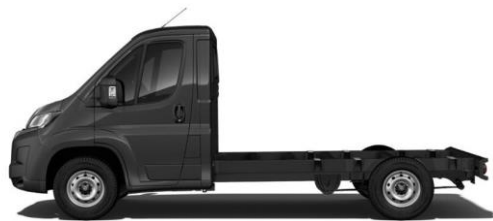
GRAPHIT GRAU M0E9 700,00 (833,00)